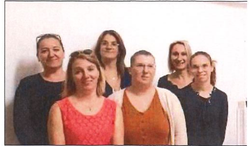
Les dernières semaines de l'année vont être bien remplies pour l'APE.